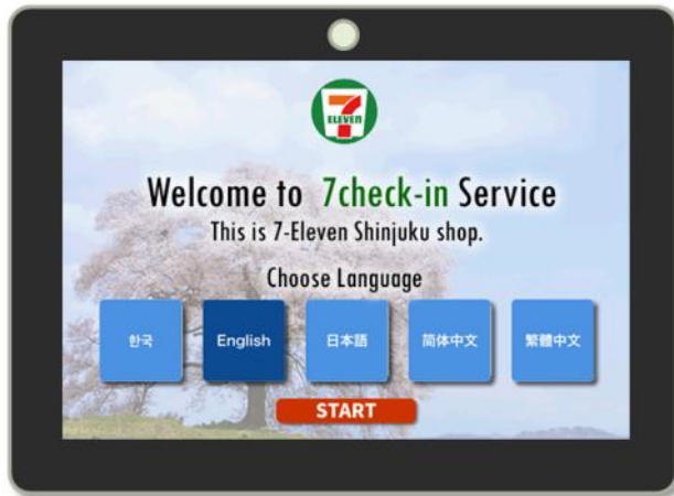
チェックイン画面