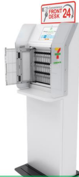
セブンチェックイン機 (イメージ)