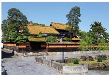
有隣荘/写真提供：大原美術館