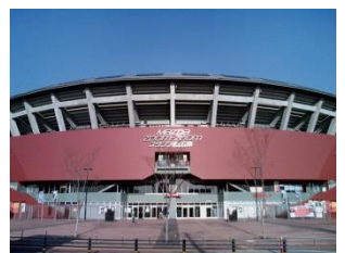
マツダスタジアム

セ・リーグを連覇し有数の人気球団となった広島カープ。本拠地マツダスタジアムのチケットは、いまや入手が困難です。スポンサードナイター「JTB日本の旬瀬戸内・山陰ナイター」を実施します。