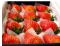
岐阜県産いちご「華かがり」イメージ