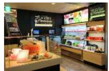
ショップイメージ