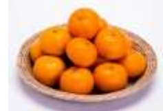
愛知県産みかん「蒲郡みかん」イメージ