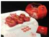
長野県産りんご「真田 RED アップル」イメージ