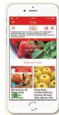
J's Agri サイト イメージ