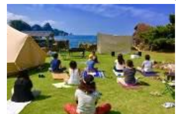
【海辺のヨガイメージ】

当プロジェクトに対し、JTBはVILLAGE INC.と協働しVILLAGing事業として人財育成等を支援いたしました。今後、岡山県玉野市など周辺地域にて展開される健康・食・農などのヘルスツーリズムを推進する玉野コミュニティ・デザイン（*1）や、地域の魅力を活かしたコンテンツを提供する事業者と連携し、体験プログラム開発等、継続的な支援を行ってまいります。