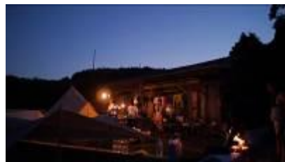
【KUJIRA-JIMA フェーストキャンプ(夜)】