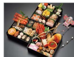
四季彩一カ (イメージ)