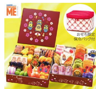
おせち「ミニオン」 (イメージ)