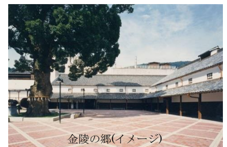
金陵の郷(イメージ)

金陵の郷は江戸時代より続く酒蔵を創業当時のまま残し、酒づくりに関する歴史と文化を今に伝える資料館です。ナイトマルシェでは、金陵の郷にある楠の大樹のもと、香川の「伝統工芸・文化」「食」「お酒」を体験できるブースが並びます。讃岐の伝統芸能獅子舞も登場して会場を盛り上げます。 ※入場料：無料(但し会場内の各種体験、飲食は有料)