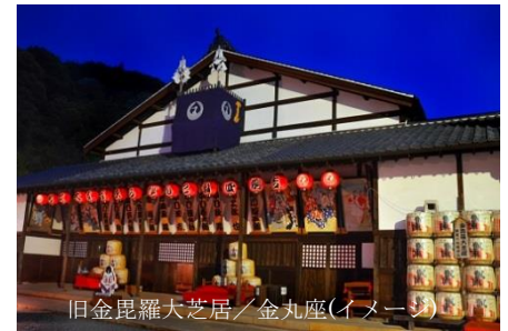
旧金毘羅大芝居/金丸座(イメージ)

また同会場では10月27日(土)13:00～16:30・10月28日(日)10:00～16:30の2日間、県内外の農村歌舞伎保存会が一堂に会し、それぞれの地域で受け継がれてきた農村歌舞伎の公演を行う「さぬき歌舞伎まつり」も開催します。※詳細は香川県公式観光サイト「うどん県旅ネット」にて9月中旬掲載予定。