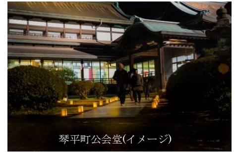
琴平町公会堂(イメージ)