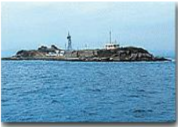
海上から見た第二海堡

明治から大正にかけて、首都東京を防衛するために東京湾・富津沖に3つの海堡（要塞）が建設されました。海堡とは、砲台を設置するために作られた人工島で、第二海堡はそのうちのひとつとなります。現在は一般の方は立ち入り禁止となっており、今回の上陸は非常に貴重な機会となります。