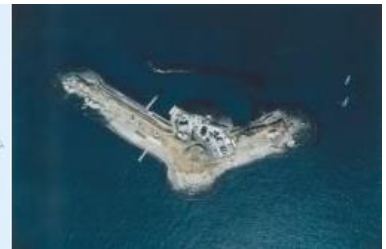
上空から見た第二海堡