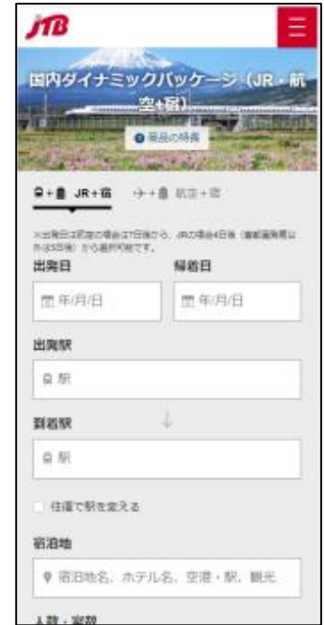
スマートフォン画面