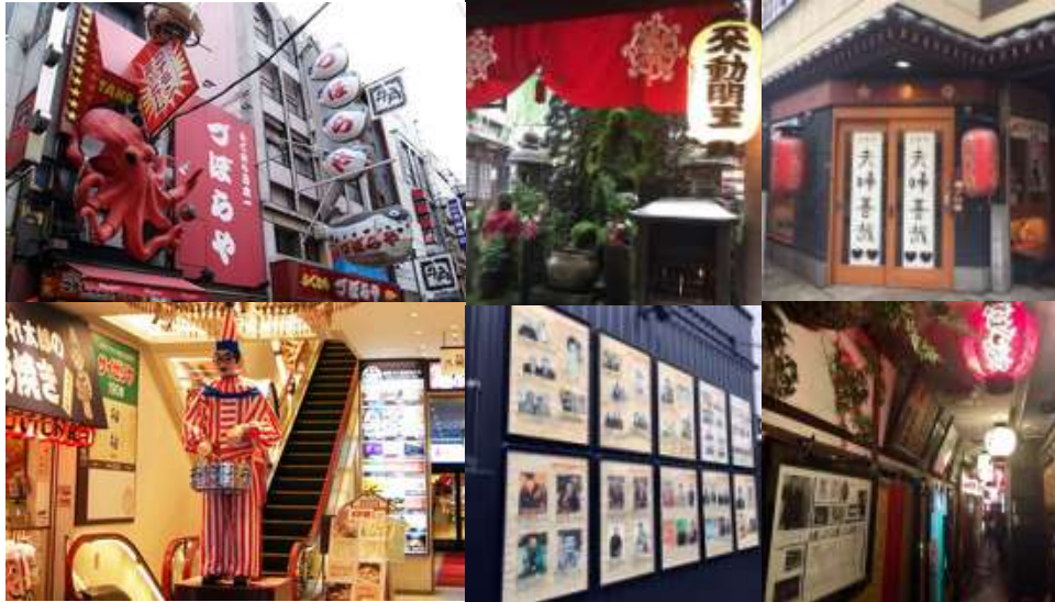
道頓堀まちあるきイメージ 上段:左から つぼらやの巨大看板、法善寺横丁の水かけ不動さん、夫婦善哉 下段:左から 中座くいだおれビル、角座の松竹歴史館、浮世小路