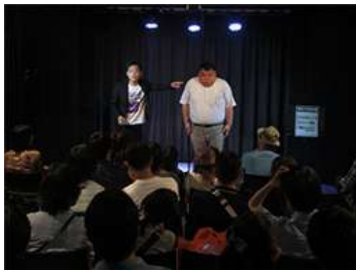
道頓堀ZAZA(お笑いLIVEイメージ)

◆対象:2018年4月1日~2019年3月31日に「エースJTB」対象商品を利用し大阪方面に宿泊のお客様