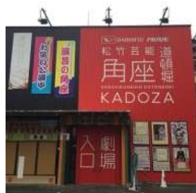
角座(外観イメージ)