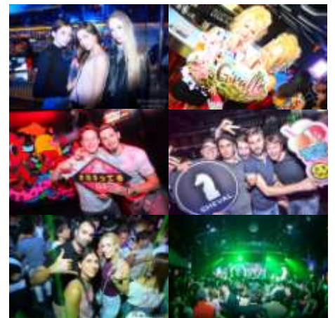
「ナイトライフ」を求める若者のニーズは世界共通 （イメージ）