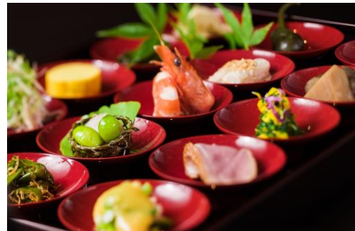
豆萬味 祇園（料理イメージ） MAMEMANMI GION

今後もJTB西日本は交流創造企業として、ユネスコ無形文化遺産に登録された「和食文化」をはじめ日本の観光資源を広く世界に発信することにより、文化振興を図ってまいります。