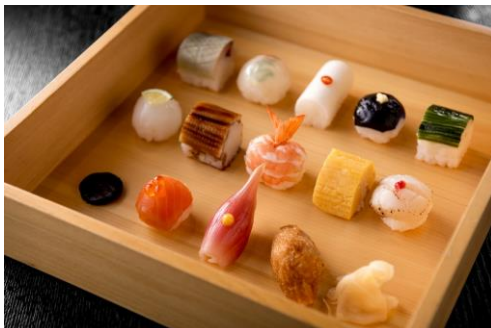
祇をん 豆寅（料理イメージ） GIWON MAMETORA

当サービスでは、オンラインでの予約を受け付けていない施設を含む京都の料亭・割烹の情報をフリーガイドブック「JAPANESE RESTAURANT RESERVATION SERVICE in Kyoto」で提供し、予約および決済をKTIC京都が代行することで、訪日外国人と料亭・割烹施設とのコミュニケーションギャップを解消し、「伝統的な和食体験」の機会を創出します。