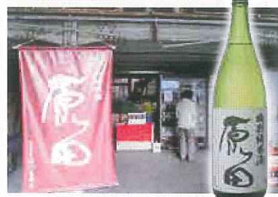
※酒蔵の写真はイメージです。

文政2年(1819年)創業。酒蔵はもともと文字にて何かを残すという文化がなかったと言われております。そのため当時の資料はほぼない状態な上、資料として残っていたものも、残念ながら昭和20年の空襲で無くなってしまいました。この文政の2年目には、はつもみぢの原点である酒造りが始まり以降多くの経験が現在のはつもみぢに受け継がれています。山口県では9番目に古くからある会社です。