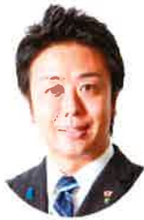
福岡市長 高島 宗一郎氏