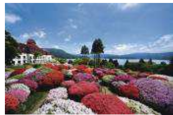
山のホテル 庭園（イメージ）