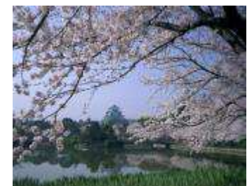
名古屋城（イメージ）