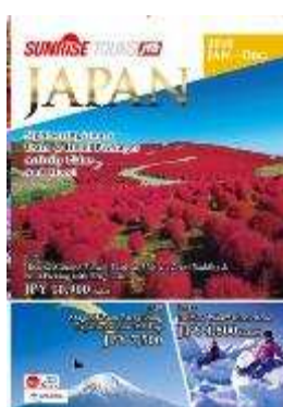
訪日外国人 (アジア) 向け パンフレット 年 1 回 9 月発売