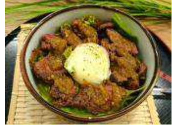
ハラール認証昼食（イメージ）