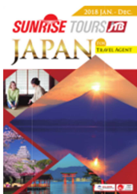
海外旅行会社向け 合冊版パンフレット 年 1 回 9 月発売