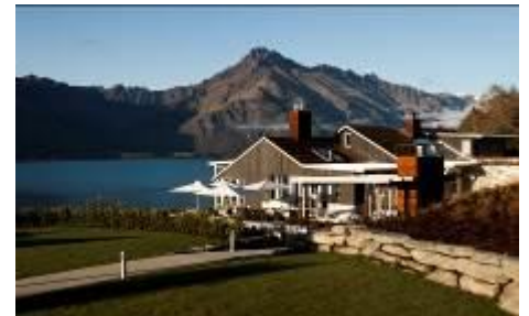
マタカウリロッジ外観 (イメージ)

特徴:滞在すること自体に価値があると言われるニュージーランドのラグジュアリーロッジ。中でも息をのむような美しい景色に囲まれたロケーションにあるマタカウリロッジに 3 連泊します。ニュージーランド政府観光局の企画協力により、ご出発前には観光局職員による個別セミナーもご用意いたします。