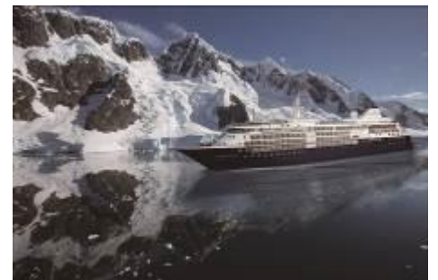
南極クルーズ(イメージ)

特徴:南極探検船の中でも最もラグジュアリーと形容されるシルバークラウド・エクスペディションでは、69 m を誇るロイヤルスイートを利用。通常船内に日本語係員はおりませんが、今回はお客様だけの日本語専任コーディネーターが乗船から下船まで完全に同行し、安心の船旅の実現をサポートいたします。