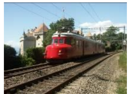
専用列車(イメージ)

特徴:氷河特急を除くスイス国内の鉄道移動では、お客様専用の車両を通常車両に連結して運行。かつてチャーターがスイス国内の移動に用いた専用車両「チャーター」やチャーター専用サロンカーである「サロン・デ・リュックス」などで紅葉のスイスをお楽しみください。