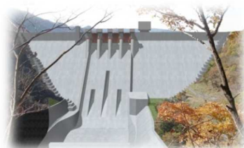
ハツ場ダム完成予想図

そして本年4月からは、日本が開発した「高速施工技术：愛称名 いだてん（巡航RCD工法）」により、工事全体のスピードが大幅にアップしました。現在、首都圏でダム建設工事を行っているのはハツ場ダムだけとなり、貴重で見応えのある工事現場を見学することができます。