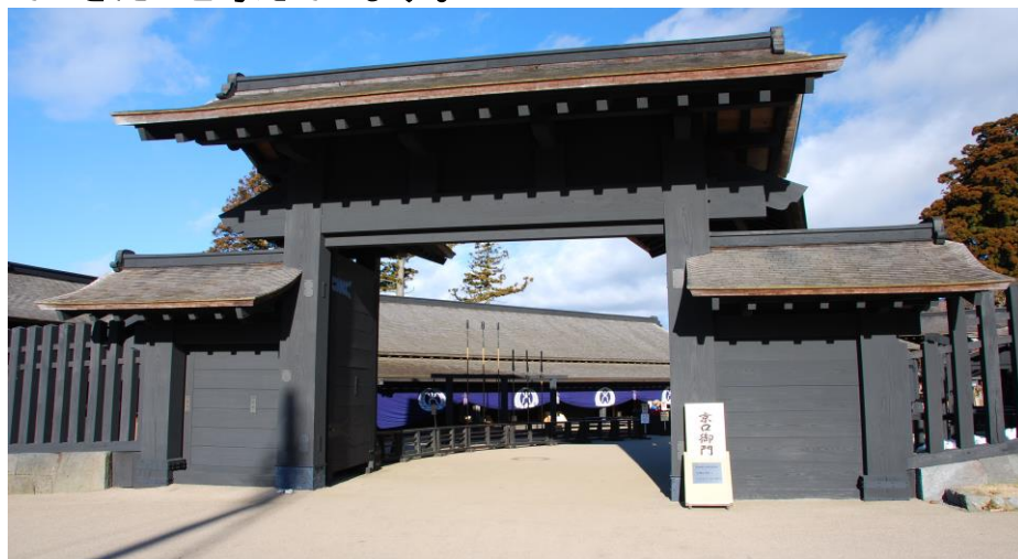
キャプション:箱根関所