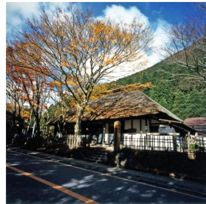
(写真はすべてイメージ)