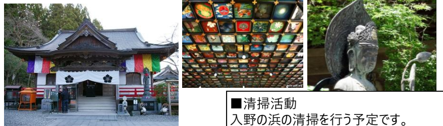
■清掃活動 入野の浜の清掃を行う予定です。

海拔320mの台地の上に立つ岩本寺は、四国霊場で唯一、阿弥陀如来、観世音菩薩、地蔵菩薩、不動明王、薬師如来の5仏を本尊としている。寺には、弘法大師にまつわる七不思議が伝わる。本堂の格天井(ごうてんじょう)は必見。高知県を中心に、全国から集められた絵が天井を埋め尽くしている。