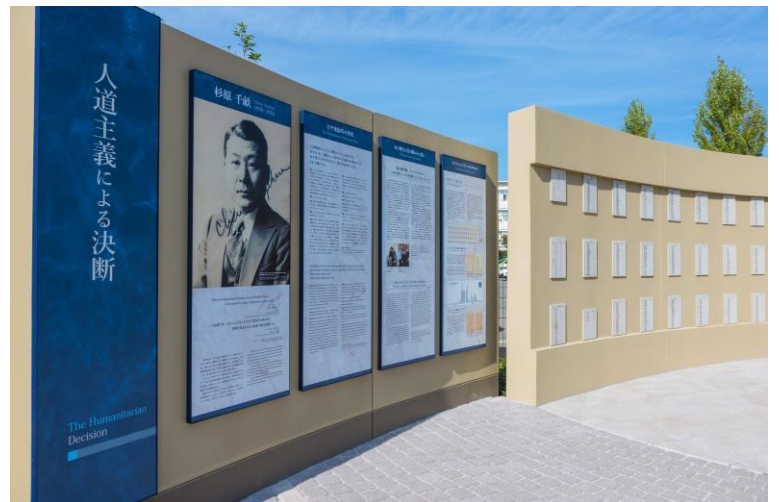
杉原千畝広場 センポ・スギハラ・メモリアル