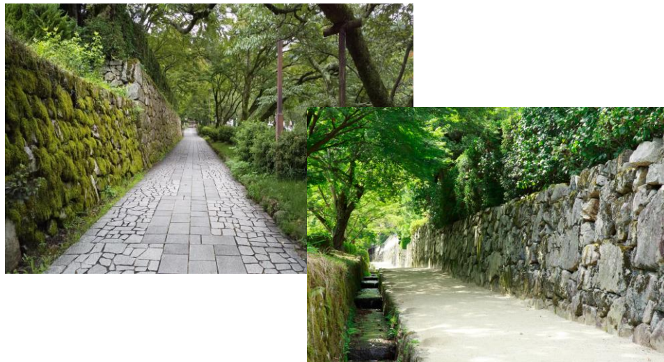
穴太衆積み石垣・日吉馬場