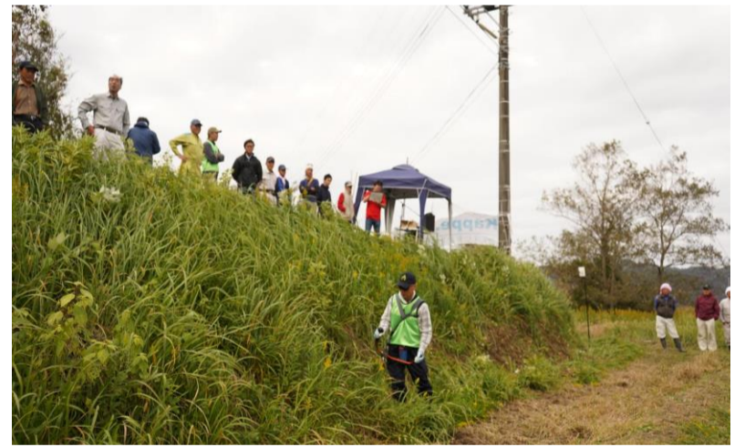
(写真はすべてイメージ)