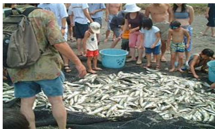
キャプション: (写真はイメージです。)