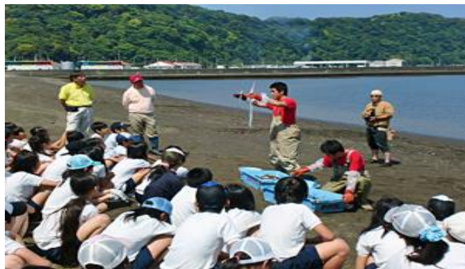
(写真はすべてイメージ)

千葉県館山湾は昔から地引網漁が盛んだったが、現在はこの漁を行っている漁師は少なくなった。多田良海岸沖に仕掛けた地引網を手繰寄せて浜まで引き上げる。地引網漁法の仕組みを理解し、南房総に生息する魚類を観察する。昼食で館山湾で獲れた魚を食事し、海の恵みを感じる。地引網体験終了後、多田良海岸沿いの清掃活動を通して、海の恵みへの感謝を行動として表すプログラムとなっている。