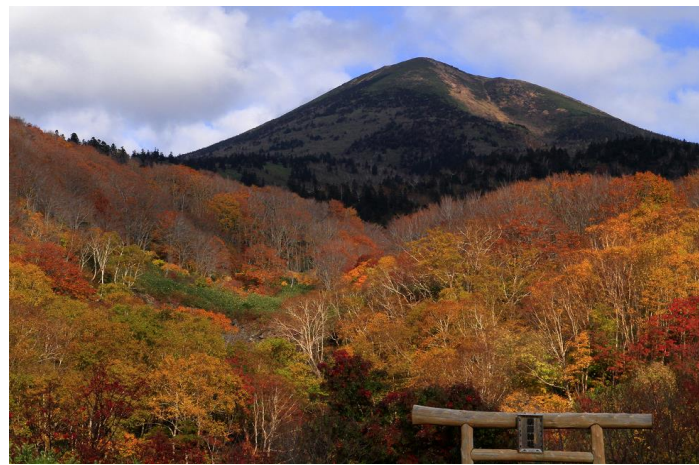
* 八甲田山の紅葉