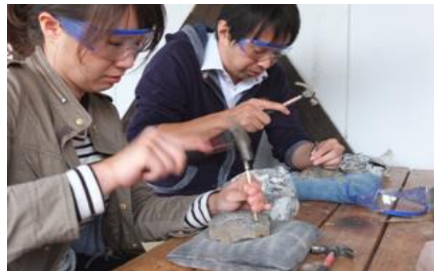
化石クリーニング：採集してきた化石標本から、余分な岩石や泥を取り除いてきれいに整形する作業

北海道むかわ町では、国内最大の恐竜全身骨格化石(通称：むかわ竜)が発掘され、“今世紀最大の発見”と報道やテレビ特集で大きくとりあげられるなど、国内外から注目を集めています。こうした価値を生かし、恐竜を核とした持続的なまちづくりを推進するため、「恐竜ワールド構想」を策定し、民間主体推進組織である「恐竜ワールドセンター」を中心に、新たな産業の振興や教育教材としての活用に取り組んでいます。まちづくりの取組みを説明した後、センターのスタッフと交流しながら、化石の発掘やクリーニング体験を行い、「むかわ竜」の価値について理解を深めるプログラムです。