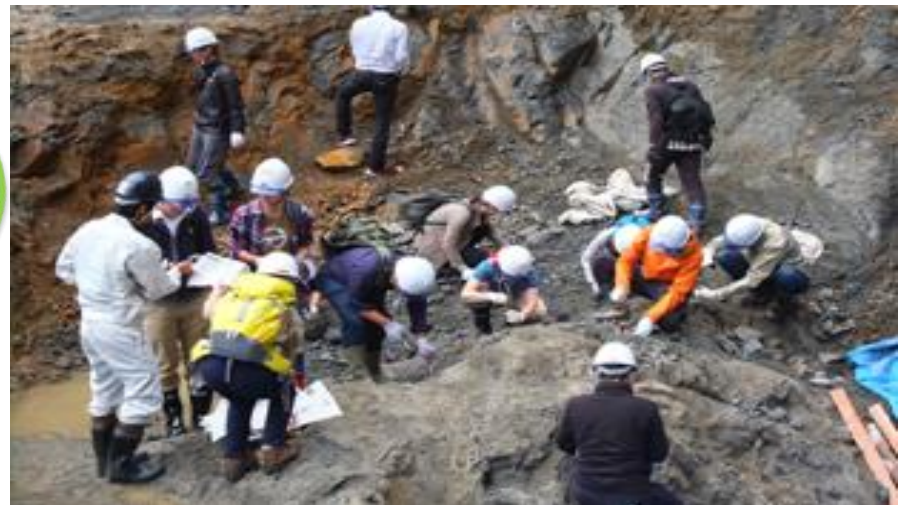
7200万年前の恐竜時代。むかわ町は海の底だった。後期白亜紀の地層から多くの化石が発掘される