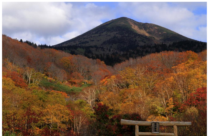
* 八甲田山の紅葉