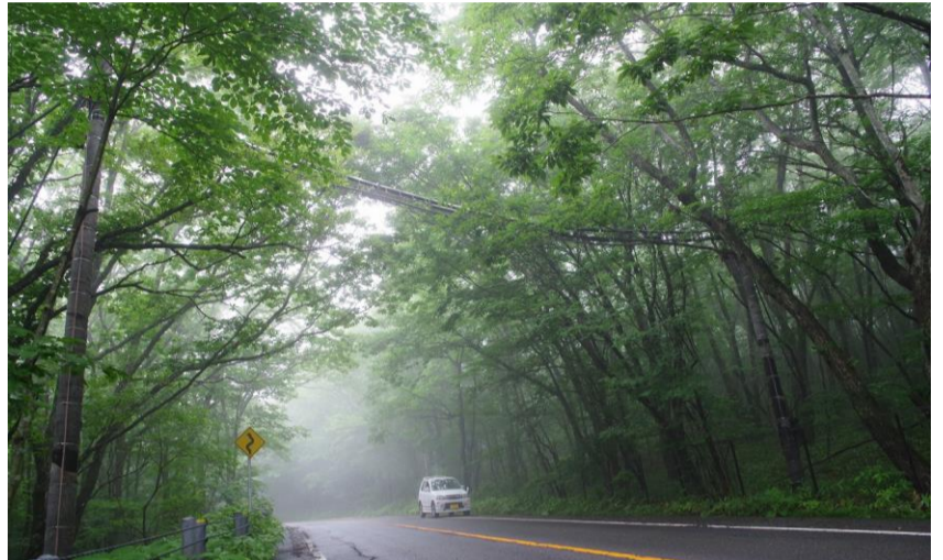
那須平成の森「アニマルパスウェイ」