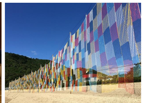
(写真はすべてイメージ)