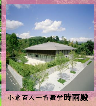
小倉百人一首殿堂時雨殿