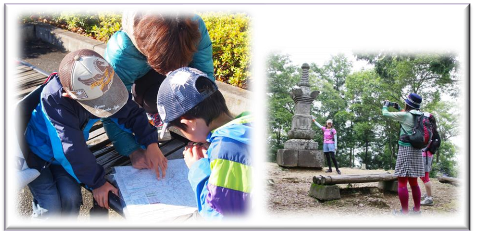
キャプション: フォトロゲイニングのイメージ写真