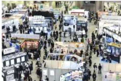
※3D Printing 2017 会場写真