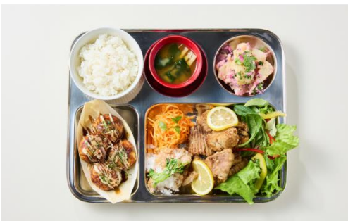
ランチプレート(イメージ)