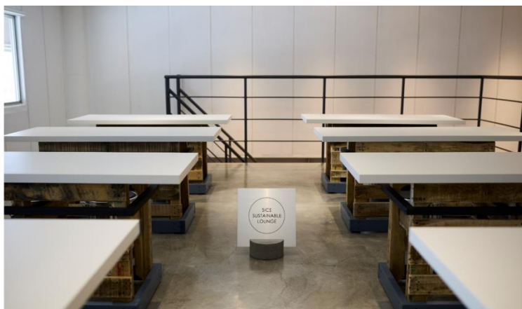
2F SICSサステナブルラウンジ内観