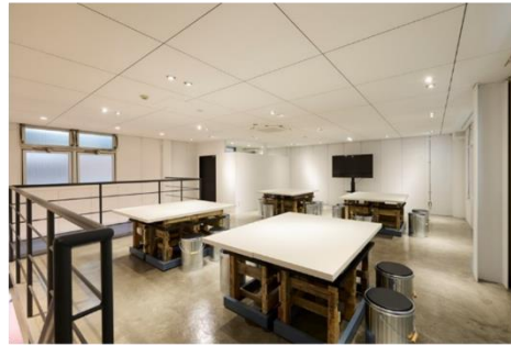
2F SICSサステナブルラウンジ内観