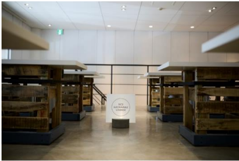
2F サステナブルラウンジ内観

・利用可能時間 9:00-18:00 ・休業日:不定休 ・利用料金:20,000円(税込)/1日 ・最大席数:20席