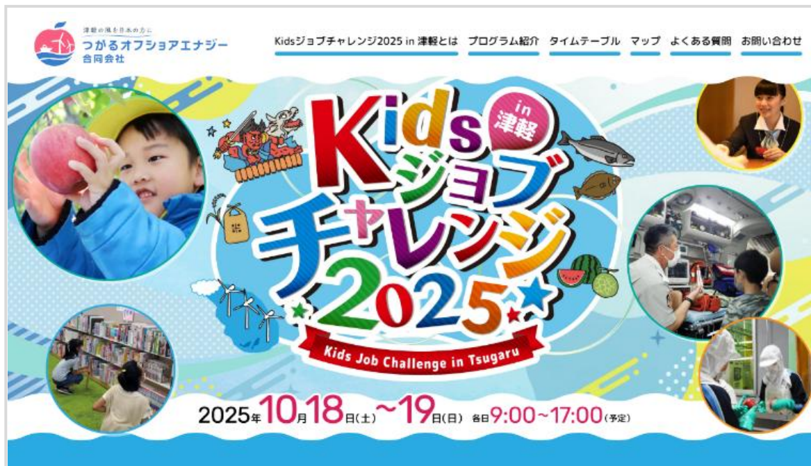
Kids ジョブチャレンジ 2025 in 津軽

地域の観光・商工・教育・環境の各分野が連携し、専用通貨を使ったリアルな経済活動を体験できる場を提供。産官学が一体となって、こどもたちの好奇心を刺激する“ワクワクする学びの場”を全国各地で創出しています。