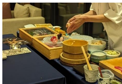
<寿司職人による和食パーティーイメージ>