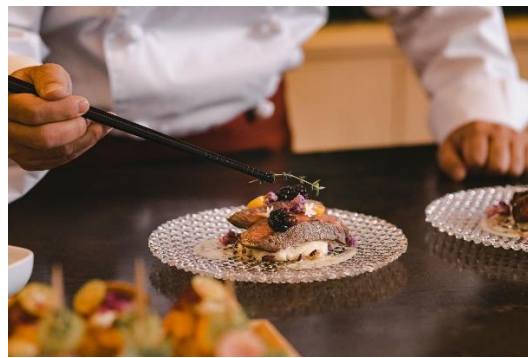
&lt;プロの料理人による料理提供イメージ&gt;