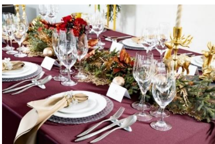
<クリスマスパーティープランイメージ>