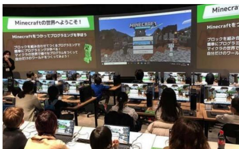
研修風景(イメージ)

日本で DX 化が進まない理由として、DX 推進を担う人材不足が挙げられており、大きな社会課題となっています。今後も各社が連携して、DX 人材不足の解消をめざし、DX 推進で実現する生産性向上に貢献してまいります。