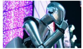
AI デザイン(イメージ)