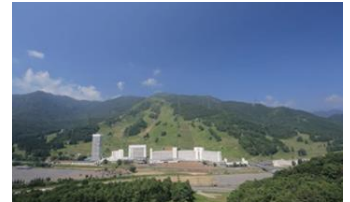
苗場プリンスホテル(イメージ)