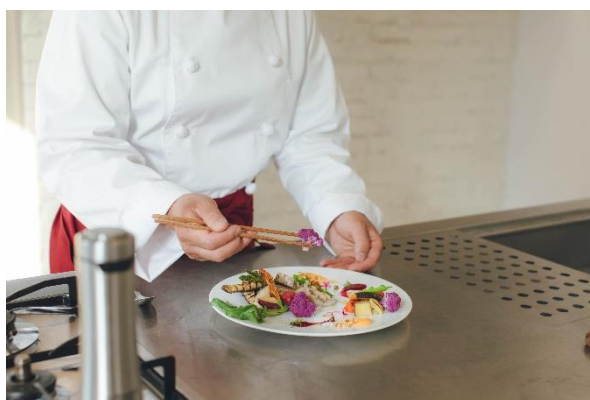
&lt;一流シェフの料理&gt;