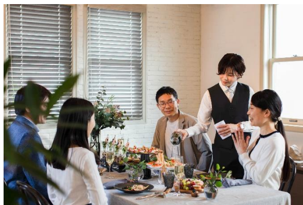
&lt;プロのサービスをご自宅で&gt;