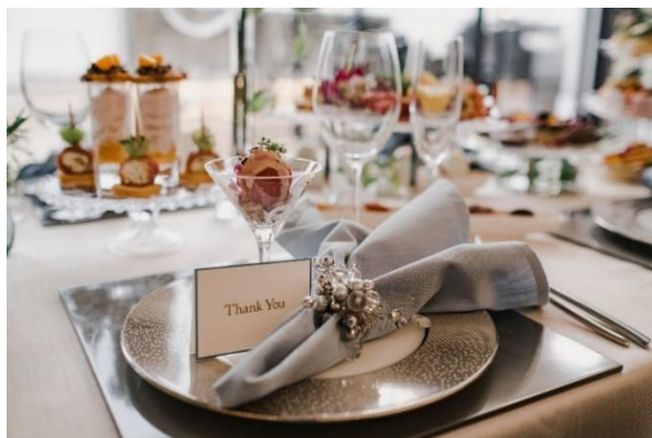
&lt;テーブルコーディネート&gt;