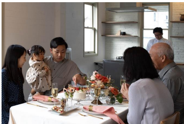
&lt;3世代での利用シーン&gt;

株式会社 JT B は、非日常的な食事体験を「感動ホームパーティー」としてプロデュースするサービス「Living Auberge(以下、「リビングオーベルジュ」)」の実証実験を2023年7月より開始します。リビングオーベルジュ(※1)はJT B の既存事業領域である「旅先」の対極にある「日常空間」における感動体験づくりに挑戦するものです。社内の新規事業公募制度からアイデアが創出されました。グループが有するホテル・レストランネットワークと具現化するプロデュース力、そして旅行事業を中心に培ってきた社員のホスピタリティを掛け合わせ、心に残る食事体験の提供や外食産業の新たなブランド体験の創出を通じて、新事業領域での「交流創造」をめざします。