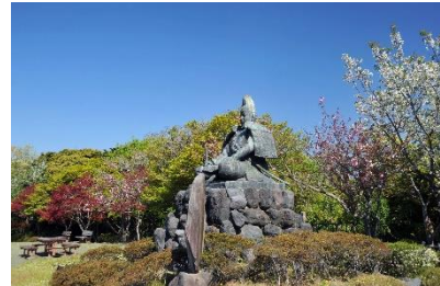
神奈川県鎌倉市(源氏山公園)

デマンド乗合タクシーは、MONET のオンデマンドモビリティサービスを活用するため、観光客はスマホアプリで希望の乗車日時と乗降場所を選択して簡単に予約することができます。また、今回は、観光客の分散周遊に繋がり、より多くの観光スポットを巡っていただくための取り組みとして、デジタルスタンプラリーによる買物割引券などの特典を提供します。JTB と MONET は、鎌倉市観光協会の協力を得て開発した「鎌倉観光周遊パス」の提供により、鎌倉エリアの新たな魅力発見へ繋がる取り組みを進めていきます。