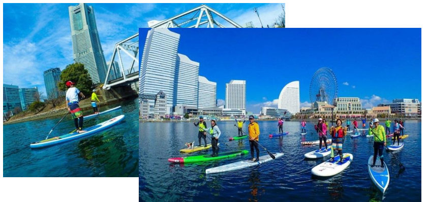
(写真はすべてイメージ)

横浜・大岡川で毎日SUPができる環境づくりを目指し活動している「横浜SUP倶楽部」の協力の下、昨今、環境課題として注目されている海上（河川上）に浮遊するプラスチックゴミをSUPで回収します。また陸上プログラムとして2015年9月の国連サミットで採択された国際目標「SDGs」についてカードゲームを通じ学んでいただきます。1日で新たな体験を通じて、楽しみながら環境に関する認識を高めていただくこれまでにないスポーツ&スタディーツーリズムプログラムです。