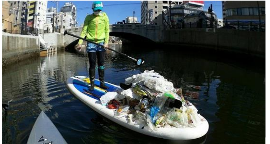
横浜SUP倶楽部によるリバークリーンの様子